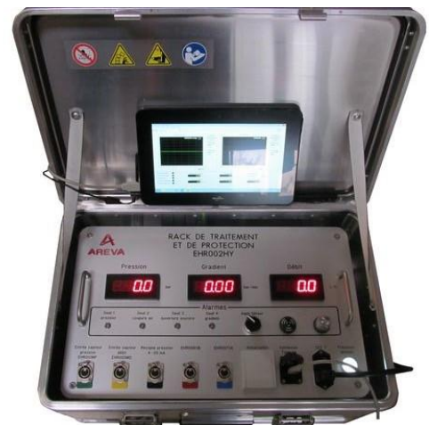
Figure 1. Rack de contrôle et de surveillance du système d'épreuve hydraulique